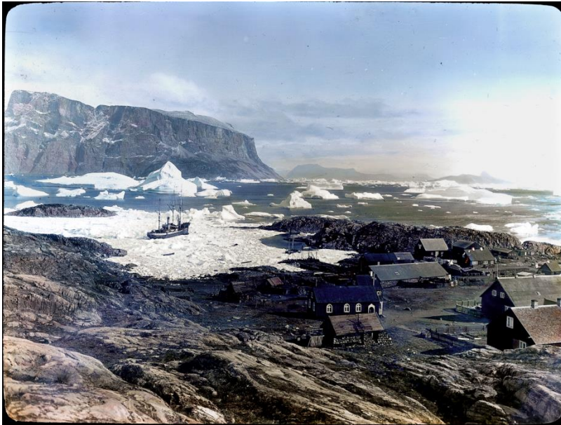
Arnold Heim August 1909, ETH Library, Image Archive