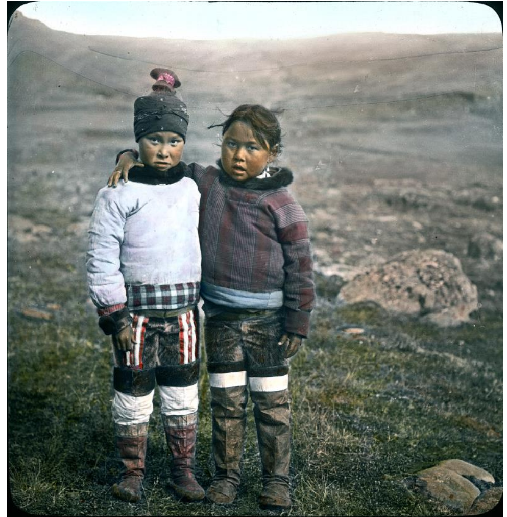
Arnold Heim, 1909, ETH Library, Image Archive